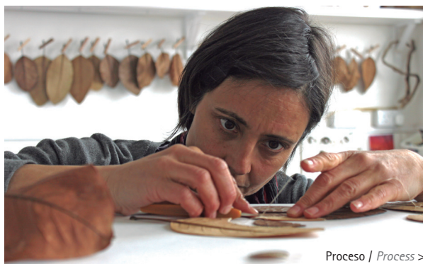
Proceso / Process >

"Trabajo con hojas naturales y con crochet, una artesanía tradicional, que puede ser tanto funcional como decorativa, aunque en mi trabajo busco trascender estos atributos. La técnica artesanal del ganchillo se convierte en un método escultórico, en mi medio para la expresión de ideas y emociones. Las hojas se trabajan con ganchos muy finos, agujas y ligeros hilos de algodón. Así, trabajando en un nivel muy detallado y pequeño, llevo al crochet hasta sus límites. La utilización de un material tan frágil como hojas enfatiza el origen delicado del tema que me interesa: la ternura y la tensión en las conexiones humanas, la belleza transitoria pero duradera de la naturaleza que se puede encontrar en el más mínimo detalle, vulnerabilidad y resistencia que podría transferirse a la naturaleza como un todo o conformando las historias de seres individuales.