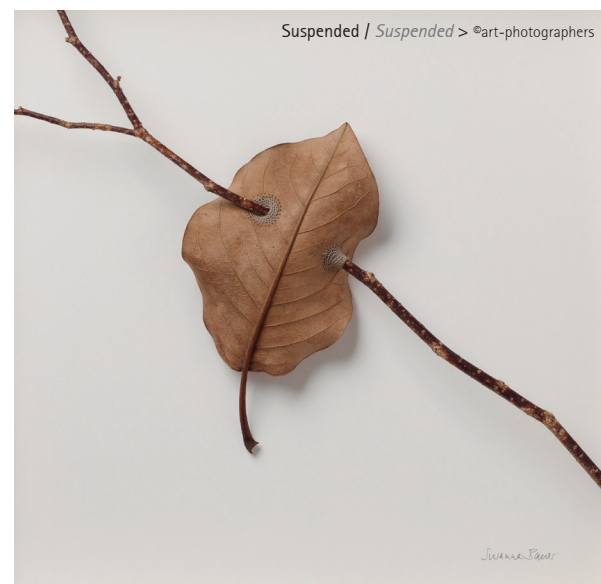
Suspended / Suspended