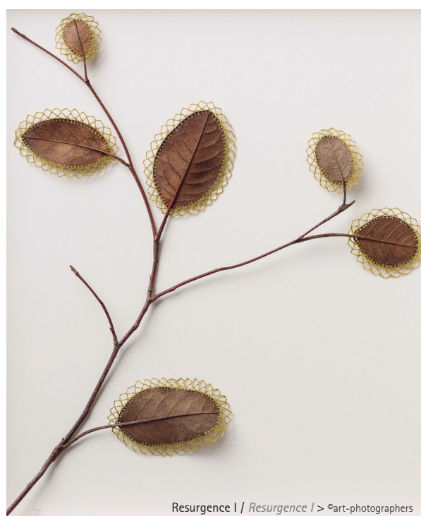
Resurgence I / Resurgence I