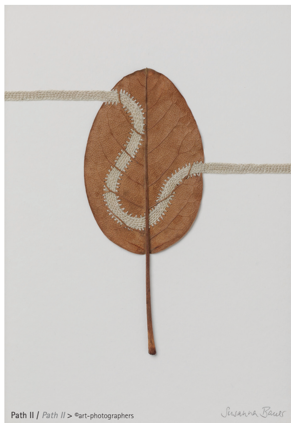
Path II / Path II > ©art-photographers