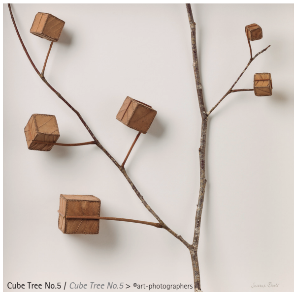
Cube Tree No.5 / Cube Tree No.5 > ©art-photographers

"I work with natural leaves and crochet, a traditional craft, which can be both functional and decorative, although in my work I seek to transcend these attributes. The craft technique of crochet becomes a sculptural method, my means to the expression of ideas and emotions. The leaf works are created with very fine hooks, needles and thin cotton threads and by working on a very detailed and small level I am pushing crochet to its very limits. Using such a fragile material as leaves underlines the delicate nature of the subject matter that I'm interested in - the tenderness and tension in human connections, the transient yet enduring beauty of nature that can be found in the smallest detail, vulnerability and resilience that could be transferred to nature as a whole or the stories of individual beings.