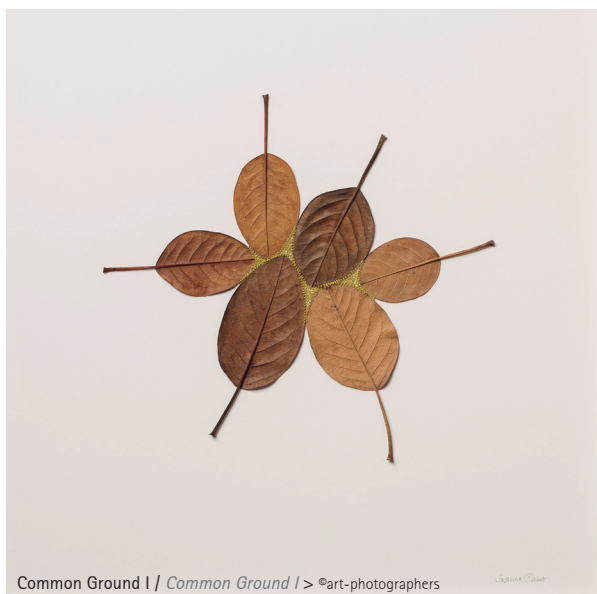
Common Ground I / Common Ground I