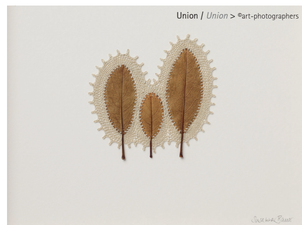
Union / Union